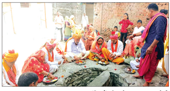
हरिभूमि न्यूज ► जावर

जावर क्षेत्र के ग्राम कजलास में प्राचीन सिद्धपीठ श्री शीतला माता