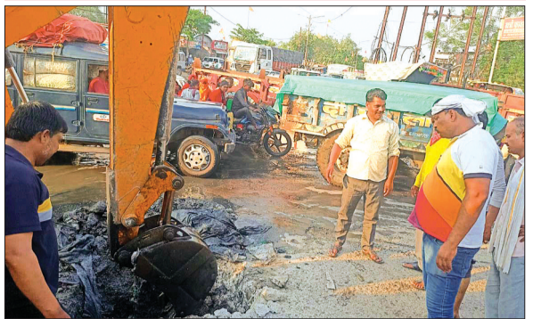
हरिभूमि न्यूज ► आष्टा

सोमवार को दोपहर 4 बजे बाद मोपाल नाके पर लंबा जाम लग गया कन्नौद मार्ग पुराना मोपाल इंदौर मार्ग पर लंबी वाहनों की लाइन लग गई जाम के कारण चारों ओर वाहन चालकों को परेशानी का सामना करना पड़ा। बता दें कि मोपाल नाके पर चार दिनों से नाला चौक है जिसके चलते गंदा पानी चौराहे पर बह रहा है नगर पालिका आज जाकर जागी और सुधार कार्य शुरू किया लेकिन नगर पालिका के जिम्मेदार या भूल गए कि यहां चौराहा अतिव्यस्ततम है और सफाई कार्य रात में करना था। जैसे ही आज 4 बजे जेसीबी को मदद से नाले की सफाई कार्य शुरू किया जैसे ही चारों ओर वाहनों की लंबी लाइन लग गई देखते ही देखते मोपाल नाके से कॉलोनी चौराहा तक वाहनों की लंबी लाइन लग गई ऐसा ही कुछ हाल पुराना मोपाल इंदौर मार्ग पर दराहा तक वाहनों की लाइन लग गई, इस दौरान यात्री बस वालों को भी परेशानी उठाना पड़ी करीब डेढ़ घंटे के जाम से पूरे शहर वासी परेशान रहे।