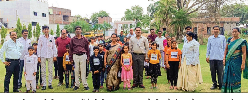
कल्याण विभाग की टीम द्वारा बच्चों के फिजिकल टेस्ट लिया गया।

शासन की योजना अंतर्गत शारीरिक दक्षता के आधार पर विद्यार्थी उपयुक्त खेल का चयन कर इसी क्षेत्र में वह अग्रसर हो इसके लिए स्पोर्ट्स टैलेंट टेस्ट का आयोजन किया जा रहा है। इसी क्रम में सीहोर जिले के श्यामपुर तहसील के रेड रोड हायर सेकेंडरी स्कूल अहमदपुर में कार्यक्रम आयोजित किया गया जिसमें अहमदपुर संकुल केंद्र के अंतर्गत आने वाले अहमदपुर तिनोयलिया चरनाल और बरखेड़ा हसन के अंतर्गत आने वाले शासकीय स्कूलों के 8 से 11 वर्ष की आयु के बच्चों का स्पोर्ट्स टैलेंट टेस्ट लिया।