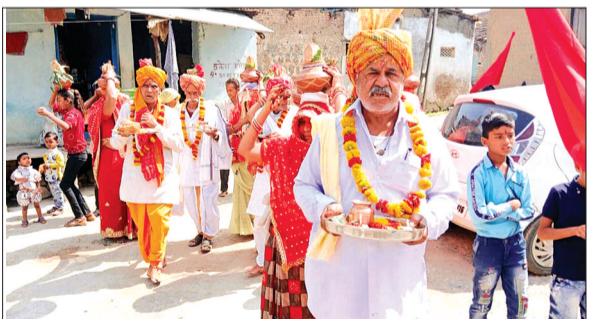
मंदिर में प्रतिवर्ष अनुसार इस वर्ष भी मेले का आयोजन प्रारंभ हो गया है। जो कि 15 अप्रैल से 23 अप्रैल को हनुमान जन्मोत्सव पर समापन

जावर क्षेत्र के ग्राम कजलास में प्राचीन सिद्धपीठ श्री शीतला माता